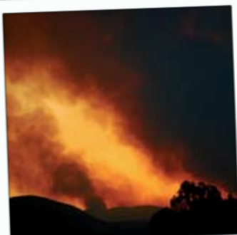
Горски пожар в Гърция. Климатичните промени засягат всички нас.