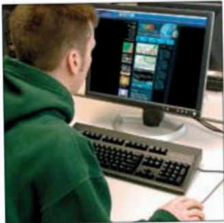
Проектът е-КЛЮЧ популяризира е-участието на младите хора.