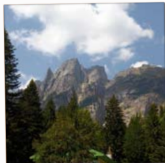
Рила (България). Запазването на екосистемите ще спре климатичните промени.

Интернет страницата www.e-clau.net е сърцевината на проекта. Тя дава обстойна информация за етапите, форумите по места и възможностите за участие в мрежата на обществото на младите европейци. Ако сте млад човек, посетете нашата Интернет страница и участвайте в дебатите или ни изпратете новини, статии, снимки или други материали по представените теми!!!