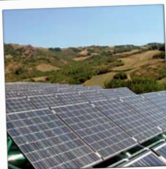
Фотоволтаична система в Реджо Емилия (Италия).