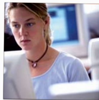
Страницата www.e-clau.net е същността на проекта е-КЛЮЧ.